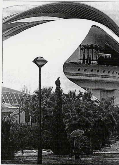
CACSA. Vista exterior del Palau de les Arts, en una imagen reciente.

Así mismo, la autonomía en manos de Francisco Camps