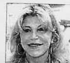
Portrait of a woman, likely related to the 'Hoy cumplen años' section.