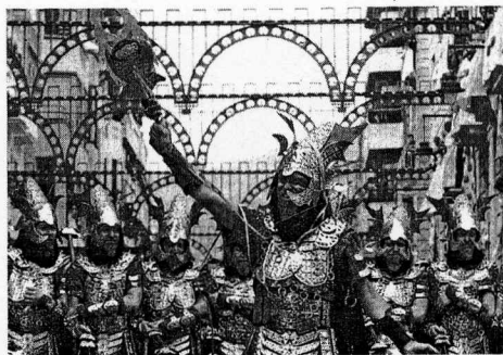
Desfile de Moros y Cristianos en Jávea

El próximo miércoles comienza el programa de las populares masclétas nocturnas de las Hogueras de San Juan en Alicante.