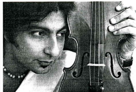
Ara Malikian actuará hoy en el Palacio de Cervelló

El Palacio de Cervelló (Pl. Tetuán, 3) acogerá la última actuación que, antes del verano, nos propone el Festival «Música, historia i art», mañana jueves día 14 de junio, a las 20.15h. En esta ocasión, el violinista Ara Malikian, sin duda uno de los músicos más brillantes y expresivos de su generación, nos presentará un programa con repertorio de música de cámara para violín y