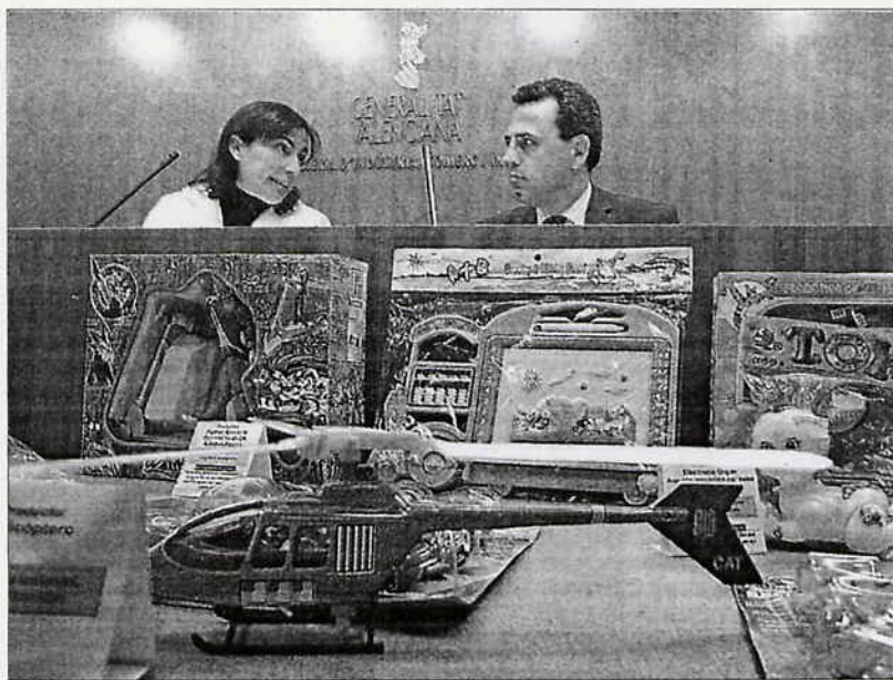
La directora de Comercio y el presidente de Avacu mostraron algunos juguetes retirados del mercado.

Otros 30 cumplían todos los requisitos y en nueve de los casos los productos fueron totalmente rechazados por incumplir con la normativa de seguridad. Además, la Comunitat Valenciana incluyó a seis de estos productos luminosos en la red de alerta por su peligrosidad.