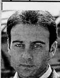
Enrique Ponce, torero (37)