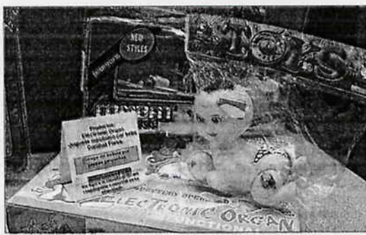
Algunos juguetes retirados presentan un gran riesgo los menores. P. A.

mentir en las recomendaciones de edad para su uso, o contener piezas demasiado pequeñas que los niños pueden tragarse.