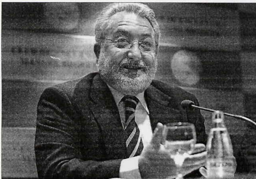
El ministro de Sanidad, Bernat Soria, en la conferencia ofrecida organizada por el Club de Encuentro Manuel Broseta.