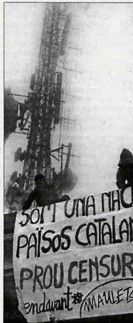
Protesta ante la antena de Alicante.

Sin embargo, las palabras del portavoz del Consell se evidenciaron, minutos después, optimistas en exceso. ACPV reiteró que en ningún caso ha pensado cerrar los repetidores de manera voluntaria. Si la Generalitat quiere clausurarlos, tendrá que hacerlo personalmente. Por eso, si la entidad no cumple con la orden antes del lunes, el Gobierno valenciano podría personarse en los centros reemisores para cerrarlos.