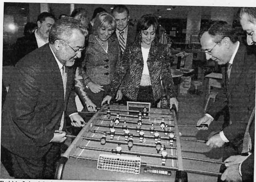
El ministro Soria, a la izquierda, juega una partida de fútbol en una reciente visita a Alicante.

En cuanto a ese porcentaje, la diputada señaló que en una sociedad de bienestar avanzada "carece de sentido", y añadió que "sólo es posible bajo un gobierno que fomenta la marginalidad como es el del PP".