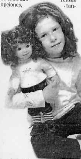
La muñeca adopta rasgos de la niña.

Otra de las novedades de las tiendas de El Corte Inglés es que, de forma progresiva, se desarrollarán una serie de artículos infantiles con proyección educativa o para el uso personal de las propietarias de Mi Yo .