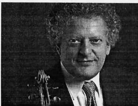
El cuarteto Arditti actúa hoy dentro del festival Ensembles

El Arditti String Quartet ofrece hoy a las 20.30 horas en el teatro Talía de Valencia un concierto en el que rinde homenaje al compositor español Francisco Guerrero, desaparecido hace una década, y a Elliott Carter con motivo del centenario de su nacimiento. La primera parte de la actuación está integrada por