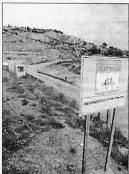
Segundo vertedero de Olocau.

JOSE MARTÍN/ANTONI RUBIO VALENCIA.- Girsra, la empresa mixta creada por la Diputación de Valencia para gestionar los residuos de los municipios continúa ocupando parcelas que no son de su propiedad en el segundo vertedero de Olocau, situado junto al primero ya clausurado. Y lo hace un año y dos meses después de que la Audiencia Provincial de Valencia decretará la ocupación ilegal de estos terrenos mediante sentencia firme y condenará a la empresa a reintegrar dichos terrenos a sus legítimos propietarios previa retirada de los desechos allí depositados.