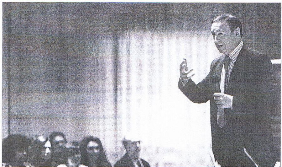
El ex director de EL MUNDO, Pedro J. Ramírez, durante su intervención ayer en el Club de Encuentro Manuel Broseta.