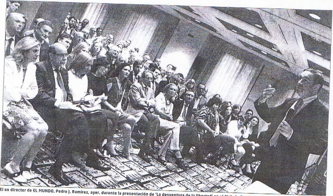
El ex director de EL MUNDO, Pedro J. Ramírez, ayer, durante la presentación de 'La desventura de la libertad' en el Club de Encuentro Manuel Broseta.

CLUB DE ENCUENTRO MANUEL BROSETA LA PRESENTACIÓN DE 'LA DESVENTURA DE LA LIBERTAD'