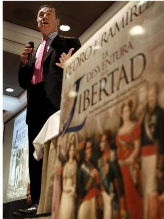
Pedro J. Ramírez, durante la presentación de su libro en Valencia.