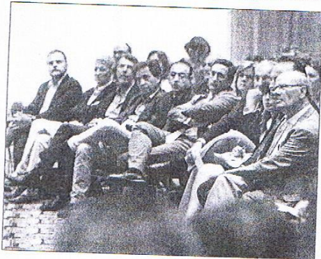
Imagen de algunos de los asistentes, ayer, en el Club de Encuentro Manuel Broseta de Valencia.