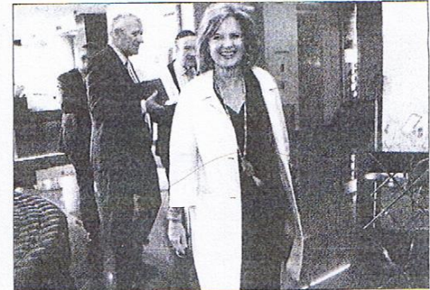
La ex diputada y ex consellera, Alicia de Miguel.