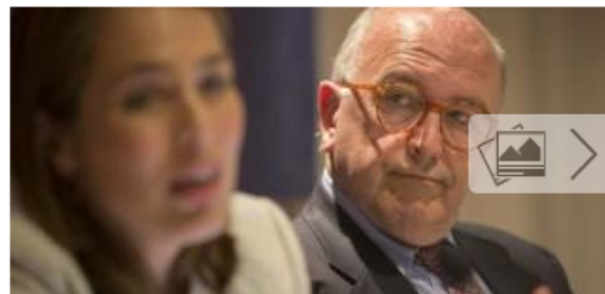
Almunia: "En Europa ven con temor nuestro alto endeudamiento"